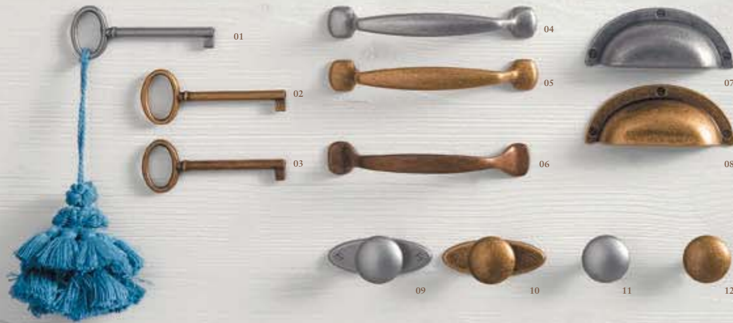
01. Chiave finitura similferro 02. Chiave finitura ottone 03. Chiave finitura bronzo antico 04. Maniglia Eidos finitura similferro 05. Maniglia Eidos finitura ottone 06. Maniglia Plados finitura bronzo antico 07. Maniglia Conchiglia finitura similferro 08. Maniglia Conchiglia finitura ottone 09. Pomolo Poseidone finitura similferro 10. Pomolo Poseidone finitura ottone 11. Pomolo Nettuno finitura similferro 12. Pomolo Nettuno finitura ottone.